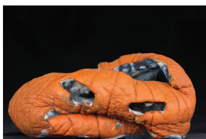
Jeanne Dunning, Untitled , 2008. Collection FRAC Occitanie Montpellier © Jeanne Dunning