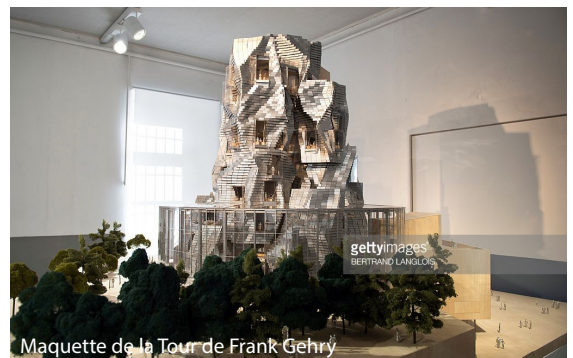
Maquette de la Tour de Frank Gehry